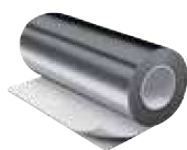
Lámina IC CLAD – Plateada