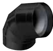
Codo preformado IC CLAD – Negro