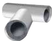
Te preformada IC CLAD – Plateado