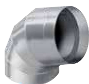
Codo preformado IC CLAD – Plateado