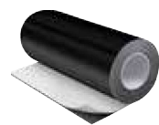
Lámina IC CLAD – Negra