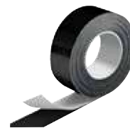
Cinta IC CLAD – Negra