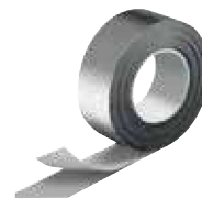
Cinta IC CLAD – Plateada