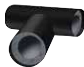
Te preformada IC CLAD – Negra