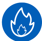
TABLA DE ENSAYOS DE FUEGO